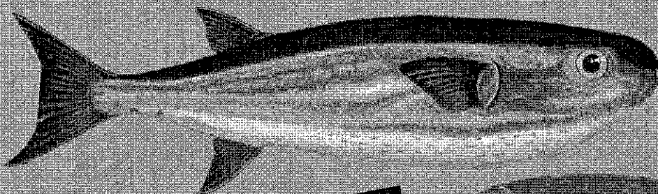
Lagocephalus lagocephalus TOSSICO al consumo

I pesci palla sono tutti tossici al consumo e per questo ne è vietata la commercializzazione. Si riconoscono facilmente per la pelle senza squame e per le mandibole provviste di due grandi denti molto taglienti. Le specie potenzialmente catturabili in acque italiane sono almeno tre.