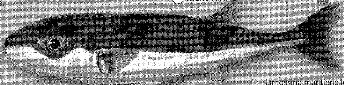
Pece palla maculato - Lagocephalus sceleratus MOLTO TOSSICO al consumo - potenzialmente mortale

La tossina mantiene le sue proprietà anche dopo la cottura