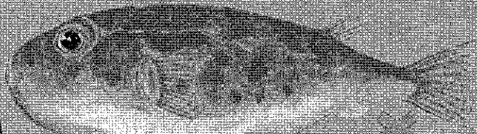
Sphaeroides pachygaster TOSSICO al consumo