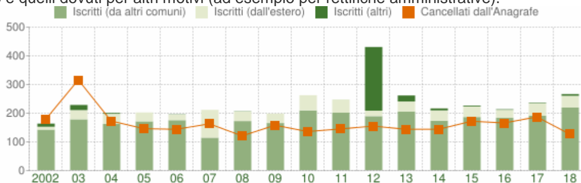
Flusso migratorio della popolazione

Fra gli iscritti, sono evidenziati con colore diverso i trasferimenti di residenza da altri comuni, quelli dall'estero e quelli dovuti per altri motivi (ad esempio per rettifiche amministrative).