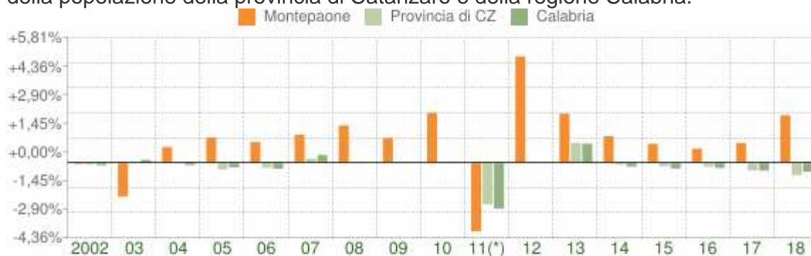
Variazione percentuale della popolazione

Le variazioni annuali della popolazione di Montepaone espresse in percentuale a confronto con le variazioni della popolazione della provincia di Catanzaro e della regione Calabria.